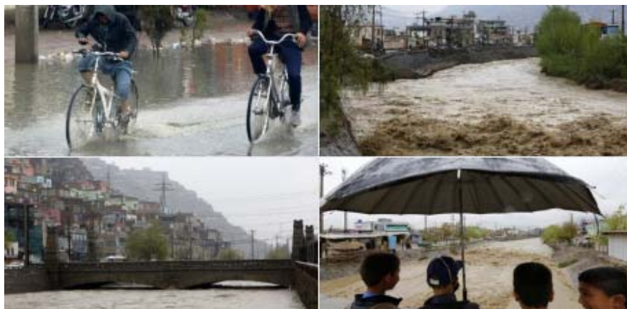
カブール市内の状況 2019.4.16